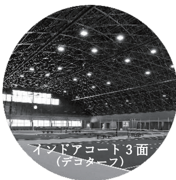
インドアコート 3面 (デコターフ)