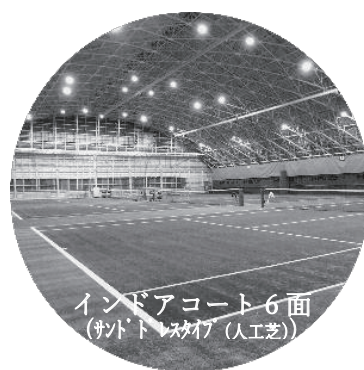
インドアコート 6面 (サンド・スタフ(人工芝))