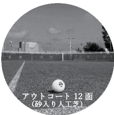
アウトコート 12面 (砂入り人工芝)